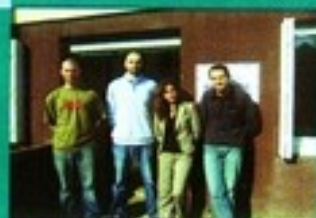
Equipe de Réussite Educative